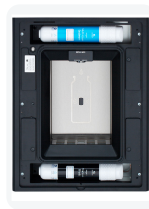
Acceso a filtros